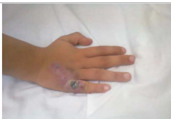
Figuras 1 y 2. Lesión verrucosa, ulcerada de bordes eritematosos con escasa secreción serosa por múltiples poros