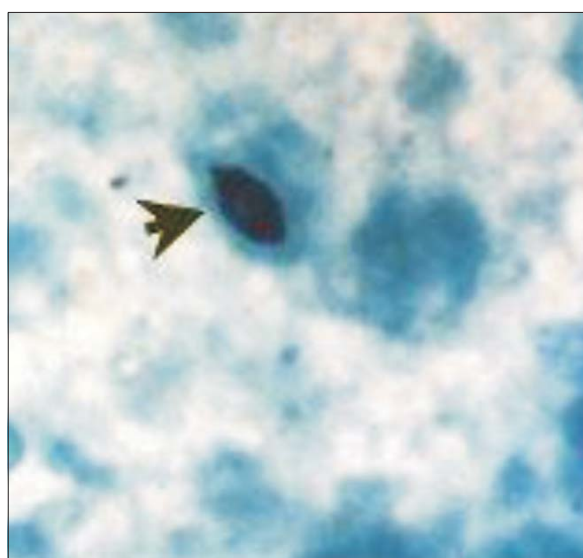
Figura 4. Examen microscópico, levadura en forma de "habano" con la coloración de Gomori.

te en cara y cuello siendo más frecuente la forma cutánea fija (15,17,18) .