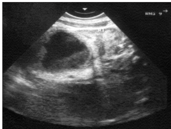
Figura 2. Tumoración quística con niveles en glándula suprarrenal izquierda