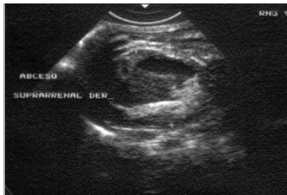
Figura 4. Absceso suprarrenal derecho con drenaje a los 7 días de evolución