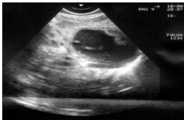
Figura 1. Tumoración quística en glándula suprarrenal derecha