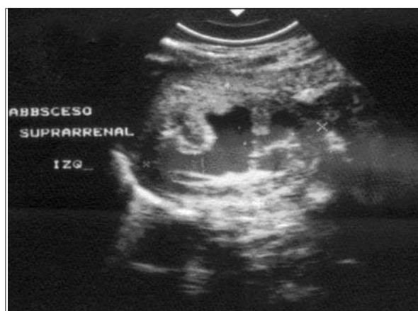
Figura 5. Absceso suprarrenal izquierdo con drenaje a los 7 días de evolución

ecográfica, de ambas tumoraciones, obteniéndose un líquido hematurulento cuyo examen citoquímico mostró abundantes pirocitos y leucocitos en un sedimento marcadamente puriforme, con LDH de 6.600 UI/l; el